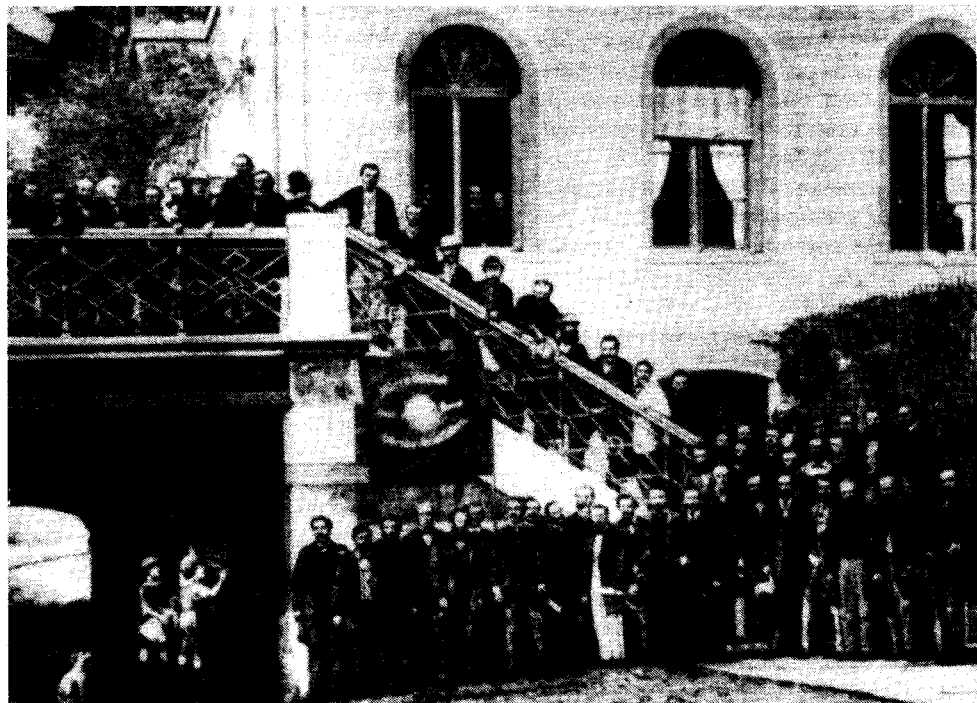
Bakounine rejoignit la Première Internationale lors de son congrès de 1868 qui s'est tenu à Bâle, en Suisse. Au cours des 25 années précédentes où il se disait révolutionnaire, il ne s'était jamais impliqué dans la lutte ouvrière contre le capital.